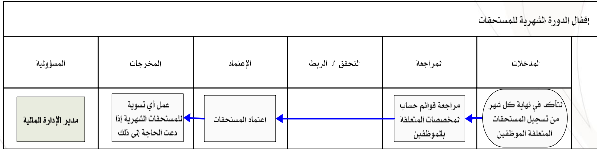
شكل رقم / ٥

يوضح المخطط البياني التالي ( شكل رقم/٥) طريقة تسلسل العمل لإقفال الدورة الشهرية للمستحقات: